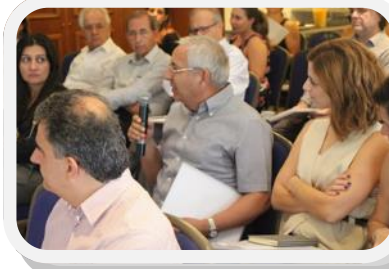
Στιγμιότυπα από τη Διάσκεψη Τύπου στις 6 Οκτωβρίου 2015.

θα προσκαλούνται ερευνητές, επιχειρηματίες, δημόσιοι φορείς και φορείς τοπικής αυτοδιοίκησης, καθώς και άλλοι σχετικοί οργανισμοί, με στόχο να ενημερωθούν για τις επικείμενες ευκαιρίες χρηματοδότησης και στη συνέχεια να υπάρξει καθοδηγούμενη συζήτηση για ανάπτυξη ιδεών για νέες συνεργασίες και προτάσεις.