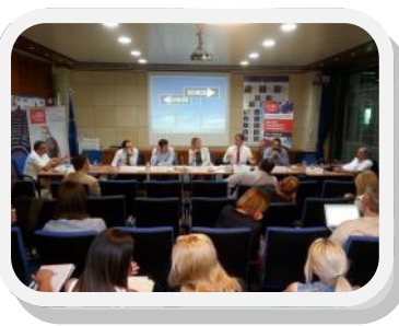
Στιγμιότυπο από την εκδήλωση.

Περισσότερες πληροφορίες: Δρ. Stéphanie Laulhé Shaelou , Αναπληρώτρια Καθηγήτρια της Νομικής Σχολής του Πανεπιστημίου UCLan Cyprus, slaulhe-shaelou@uclan.ac.uk .