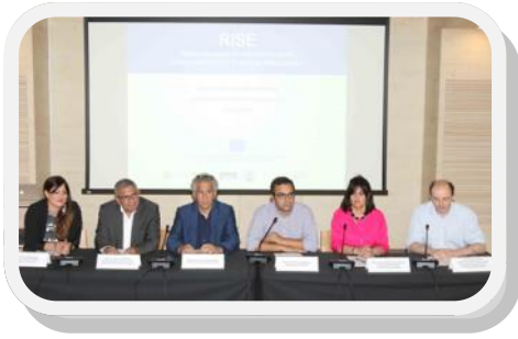
Στιγμιότυπο από τη δημοσιογραφική διάσκεψη.

Πραγματοποιήθηκε η εναρκτήρια συνάντηση της κοινοπραξίας, της οποίας συντονιστής είναι ο Δήμος Λευκωσίας, για την υλοποίηση της Δράσης «Research centre on Interactive Media, Smart systems and Emerging technologies», με την επωνυμία «RISE». Η πρώτη ενημέρωση έγινε στο πλαίσιο της προετοιμασίας και του λεπτομερούς σχεδιασμού για τη δημιουργία του RISE, με χρηματοδότηση 500,000 ευρώ περίπου, από την 1 η Φάση της Δράσης TEAMING του προγράμματος Ορίζοντας 2020 της Ε.Ε. Οι λεπτομέρειες της Δράσης δόθηκαν σε δημοσιογραφική διάσκεψη τη Δευτέρα 22 Ιουνίου 2015 από το Δήμαρχο Λευκωσίας, τους Πρυτάνεις των κρατικών πανεπιστημίων Κύπρου, τους εκπροσώπους του Max Planck Institute της Γερμανίας και του University College London του Ηνωμένου Βασιλείου που συμμετέχουν ως εταίροι στην Κοινοπραξία.