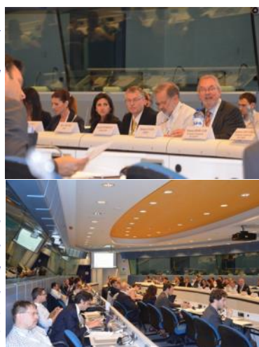
Στιγμιότυπα της εκδήλωσης.

Οι παρουσιάσεις και περισσότερες πληροφορίες διατίθενται στον ακόλουθο σύνδεσμο: http://www.eusew.eu/component/see_eventview/?view=see_eventdetail&mapType=hlpc&eventid=4449