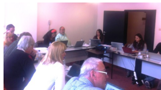
Στιγμιότυπο από τη συνάντηση της κοινοπραξίας στο Boroniec.

Το ΕΓΚ, μαζί με τους εταίρους του ευρωπαϊκού σχεδίου «Le-Math - Learning Mathematics through new Communication factors», το οποίο ξεκίνησε το Νοέμβριο 2012, συναντήθηκαν τον περασμένο Ιούνιο στο Boroniec της Βουλγαρίας, προκειμένου να συζητήσουν την πρόοδο του διετούς σχεδίου και το σχεδιασμό των μελλοντικών δραστηριοτήτων.